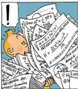
Copyright © Hergé/Moulinart 2007 Les Aventures de Tintin : L'Étoile mystérieuse / Planche 6