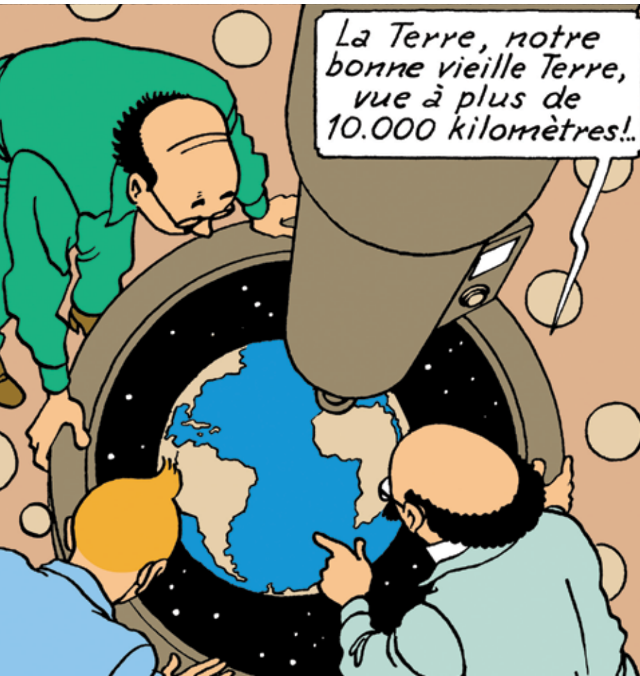
Copyright © Hergé/Moulinart 2007 | Les Aventures de Tintin : On a marché sur la Lune / Planche 4