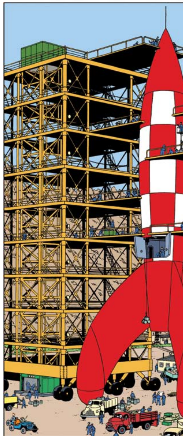
Copyright © Hergé/Moulinart 2007 | Les Aventures de Tintin: Objectif Lune / Planche 42

Le vol 71 est nettement plus long (sa durée dépasse une centaine d'itérations) et passe même par l'altitude maximale 9 232, mais là encore il revient se poser en 1.